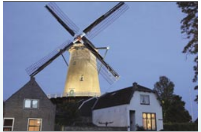
ANGELIQUE VAN LIEROP

Het Rondje Kunst op Straat is een leuke fietsroute (of lange wandeling) van 12 kilometer langs kunstwerken in de openbare ruimte van IJsselstein. De route gaat door de mooie, historische binnenstad en door verschillende wijken. De kunstwerken vertellen vaak ook iets over de plaats